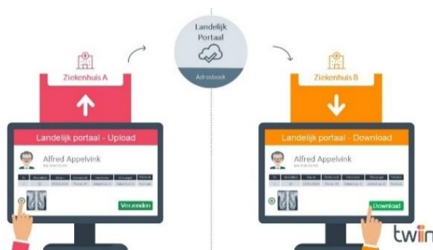
Versturen van beelden en verslagen

Voor het uitwisselen van beelden en verslagen gaat Twiin net als bij de dvd uit van een verwijzing, waarbij toestemming van de patiënt verondersteld mag worden. De zorgverlener weet vooraf naar wie het onderzoek opgestuurd moet worden. Beelden en verslagen worden uitgewisseld door deze handmatig te up- en downloaden.