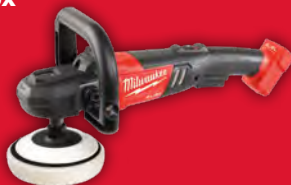
M18 FAP180-0 REF. 4933451549