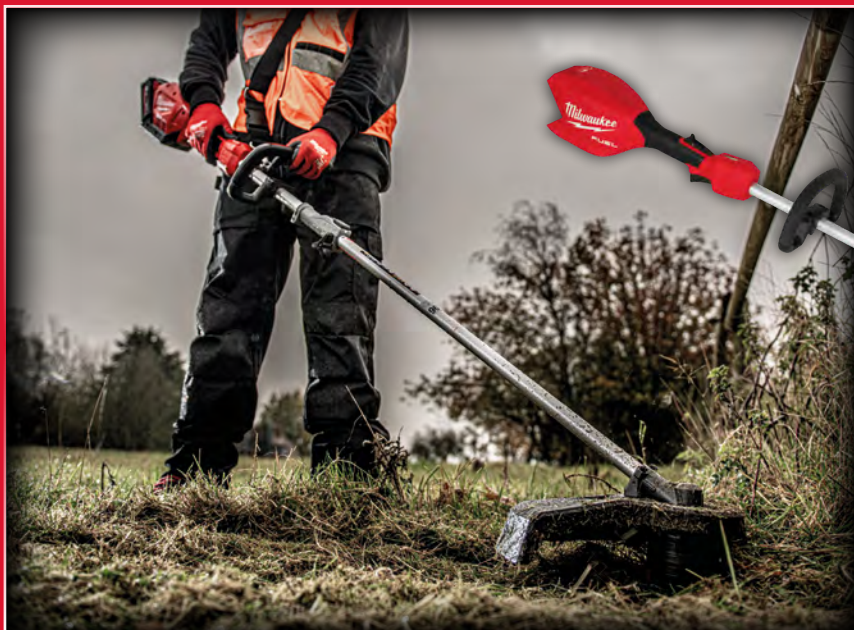
M18 FOPHLKIT2-0 REF. 4933492663