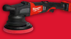
M18 FROP21-0 REF. 4933478835