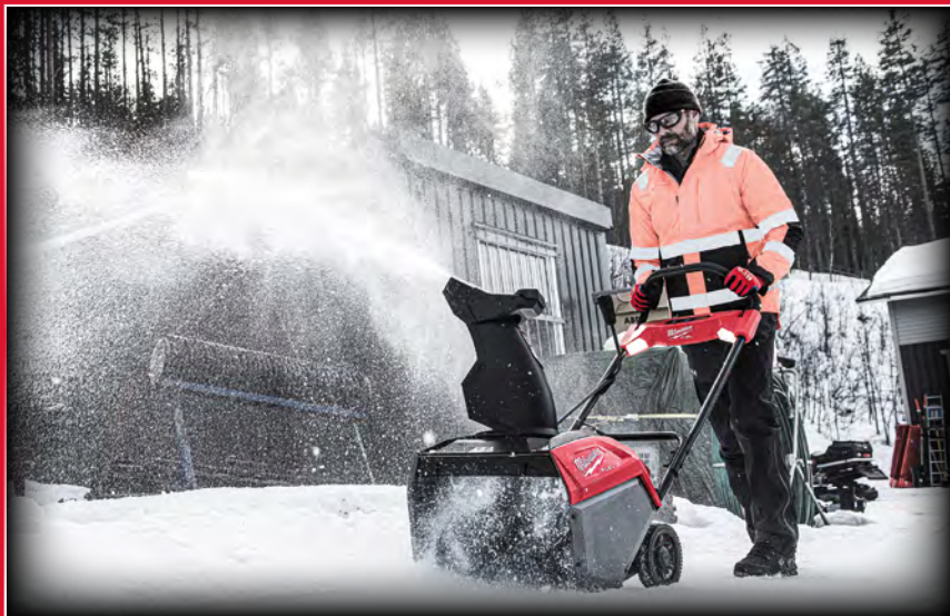
M18 F2SSBL-0 REF. 4933500054