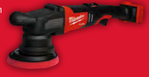
M18 FROP15-0 REF. 4933499156