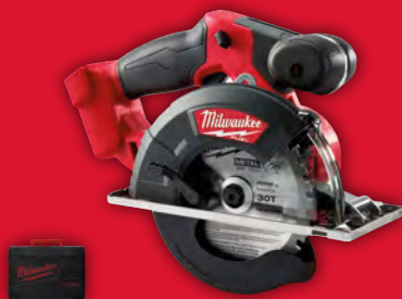
M18 FMCS-0 REF. 4933459191 285,90€ SIN IVA