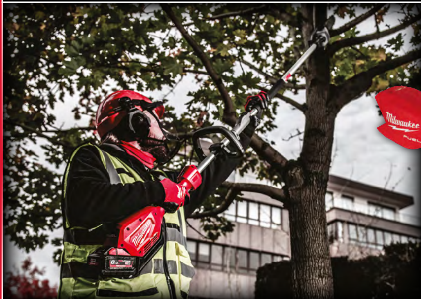
M18 FOPH2-0 REF. 4933492662