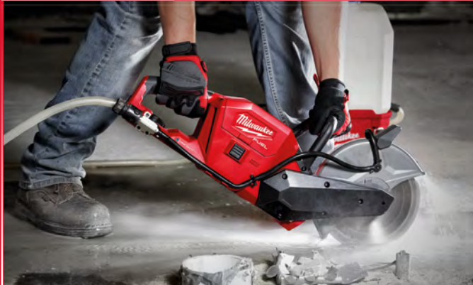
M18 FCOS230-0 REF. 4933471696