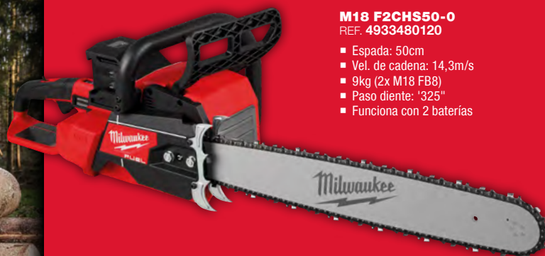
M18 F2CHS50-0 REF. 4933480120