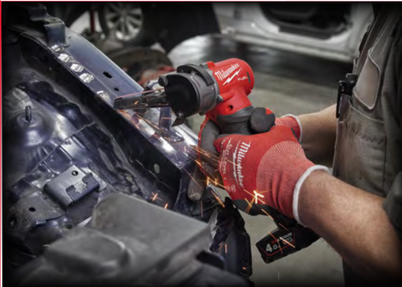
M12 FBFL13-0 REF. 4933480960