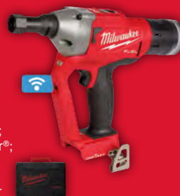
M18 ONEFLT-0 REF. 4933478636